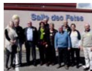
Classe 48, la mieux représentée.