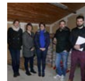
L'Amicale négocie avec le Sybert

Ainsi, courant avril, l'APE a monté un partenariat avec la ferme d'Uzel pour la vente de poulets fermiers. Cette nouvelle action présente un double intérêt : récolter des fonds pour les enfants et favoriser l'insertion professionnelle de personnes en situation de handicap.