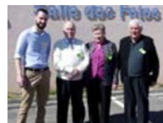
Le plus jeune et les plus anciens.

Cette année, nous avons recensé 437 personnes ; seulement 138 conscrits ont répondu, 49 favorablement et 89 négativement, avec les conjoints nous étions 92.